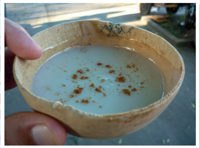
TAZA DE GUABUL.